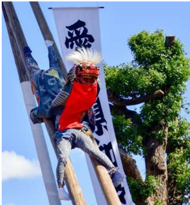
平成30年度 朝倉の梯子獅子フォトコンテスト 推薦 木村 裕親さんの作品「カブとウス」